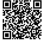
扫码了解 相关调查

只有家校协同努力,才有利于为孩子创造良好的成长环境,促进孩子健全人格的养成。陈金芳建议在寒假,家长不妨把教育与生活结合起来,在家务劳动、走亲访友、走进大自然等日常活动中,让孩子了解人情世故、开阔视野,培养他们终身受益的良好生活习惯。