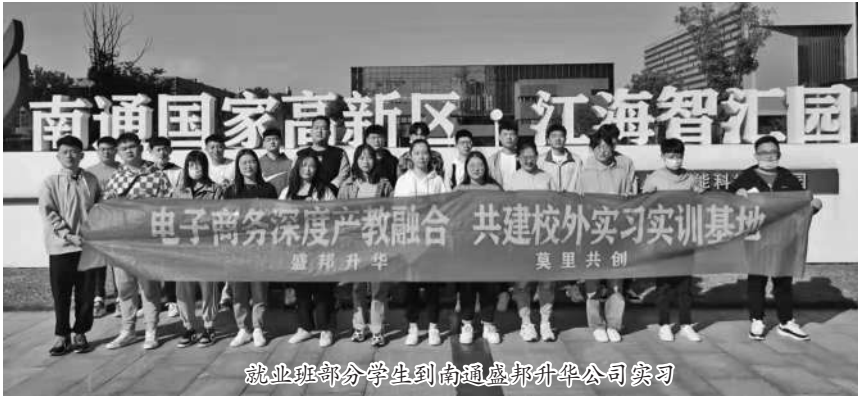
就业班部分学生到南通盛邦升华公司实习

学的步调，紧紧把握职业教育服务社会和个性发展的本质属性，开设机械加工、计算机应用、电气设备运行与控制、汽车制造与检测、会计事务、电子商务等17个专业，设有对口升学班与就业班，为学生量身定制适合的成长成才道路，打开了“升学榜上有名、就业脚下有路”的绿色通道。