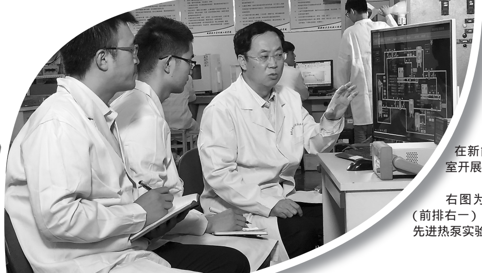
左图为华北电力大学学生在新能源电力系统国家重点实验室开展测试实验。