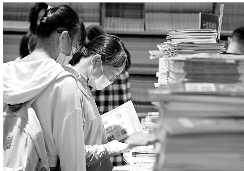
安徽一名家长和孩子在教辅专柜选购教辅资料。