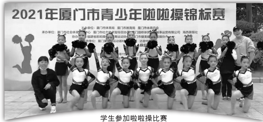
学生参加啦啦操比赛

氛围浓厚，每个班级都组建了足球队，经常开展班级足球赛。在校园足球班班联赛中，学生热情高涨，加油声、喝彩声响彻足球场。学生在享受足球运动带来的乐趣时，也培养了拼搏进取、团结协作的体育精神。