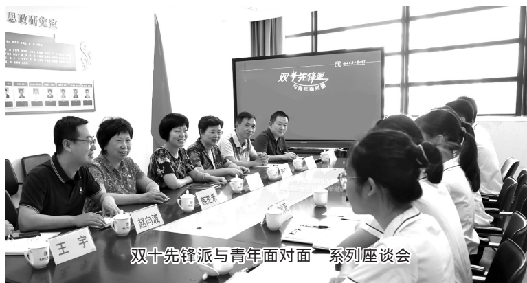
双十先锋派与青年面对面 系列座谈会

为了激活红色基因,双十中学坚持“爱国”为民这一办学主线,厚植爱国主义情怀,引导教师坚定对马