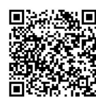
扫码了解相关调查

调查中,家长们认为,有效预防艾滋病,不仅要努力为孩子补上性教育这一课,学校还应健全预防艾滋病教育工作机制,媒体要加强新闻宣传和防艾知识的普及,全社会要共同携手重视防治艾滋病工作,为孩子筑起安全屏障。本报北京12月1日电