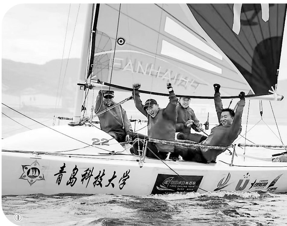
①青岛科技大学帆船队勇夺第十四届全国学生运动会帆船比赛冠军。 ②青岛科技大学学生在篮球联赛中。

不少学生家长表示,这种学分制体育教育改革,让学生走出宿舍、少玩手机、参与锻炼、发现生活中的美好,有利于养成良好生活习惯,是新颖和有益的改革。