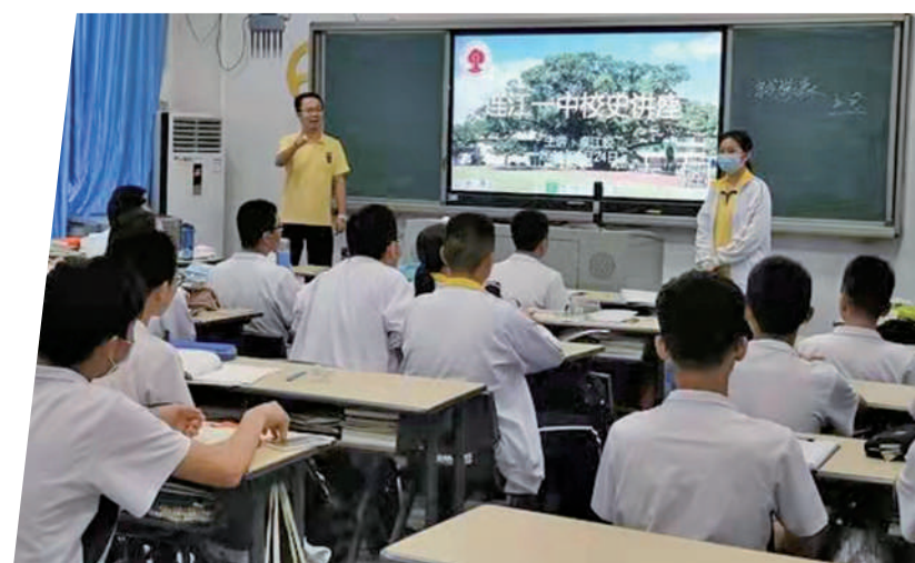
连江一中特色校本课程教学