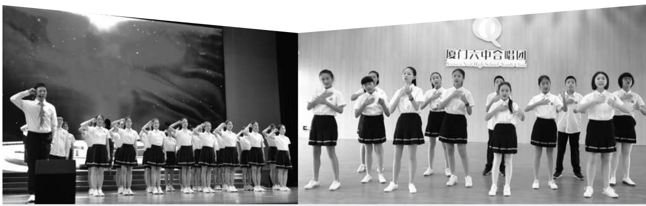
厦门六中学生思政宣讲团朗诵《我宣誓》，再现了雷锋、邓稼先、王进喜等英雄人物“知难而进，奋发向上”的工作作风和“克勤克俭，公而忘私”的奉献精神。

演绎中国风作品，弘扬中华优秀传统文化，在合唱中尽显中华优秀传统文化之美，是厦门六中合唱团的又一大特色。学生精彩的表演，征服了观众，也得到专家的认可。