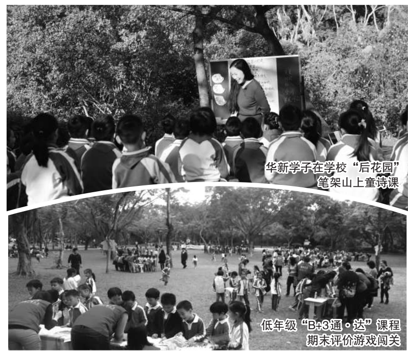
华新学子在学校“后花园”笔架山上童诗课