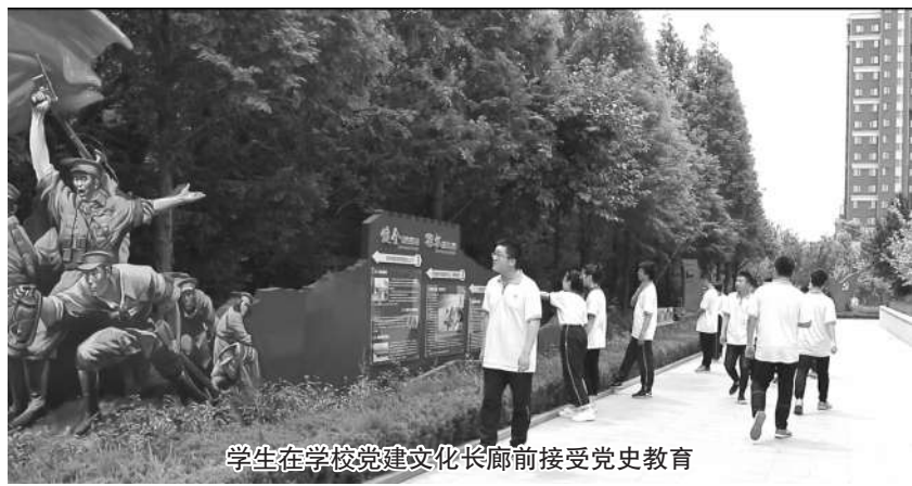
学生在校党建文化长廊前接受党史教育

年党员教师梯次培养,优先在思政课教师、班主任中发展党员,努力建设一支又红又专的教师队伍。一年来,学校新发展党员4名,10名青年教师递交了入党申请书。