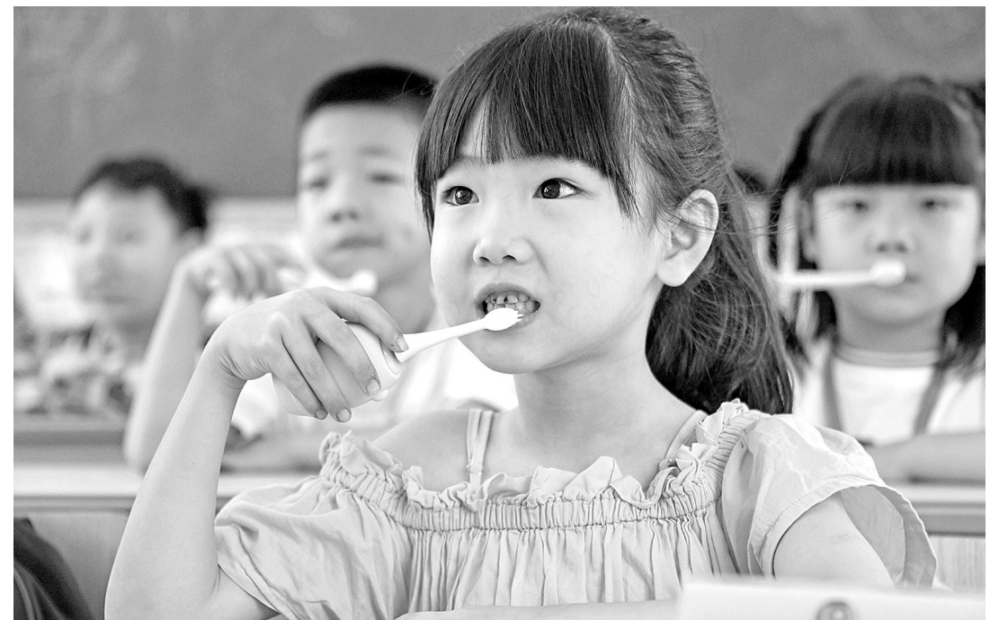
9月17日,浙江省台州市仙居县第一小学学生在听医生讲解正确的刷牙方法。

教育插上科技翅膀,让“四史”学习教育更生动、更真实。在中共宝安县委第一次党代会旧址等区内30个“四史”主题教育学习地标,宝安区30名阳光少年候选人化身“红色小讲师”,通过实地讲解、视频传播,讲好党史故事,扩大影响面。宝安区立足本土“四史”资源,推出“四史”主题教育主题地标,让书本上的文字和图片活起来。读党史经典、讲党史故事、看党史视频。今年六一,宝安区40万名师生同上班团队会。宝安还开展读红色经典、讲红色故事等活动,调动师生参与党史学习的积极性。目前,全区已组织观看632场红色电影、文艺精品展演等,28.6万人次师生参与。今年9月,海乐实验学校等7所新建、改扩建学校投入使用,新增约1.59万个公办义务教育学位。为切实解决群众的急难愁盼问题,宝安区教育局制定民生实事任务实施方案,进一步精准落实学位建设等10项区民生实事项目,实施清单销号机制。目前,宝安区教育系统共形成561个“我为群众办实事”工作项目,已完成144项重点办理事项、188项一般事项。