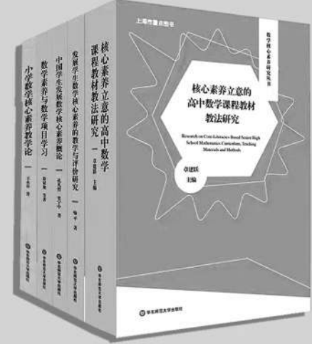
“数学核心素养研究”丛书 章建跃/主编