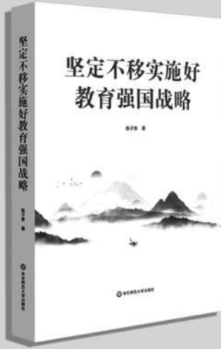
《坚定不移实施好教育强国战略》 陈子季/著