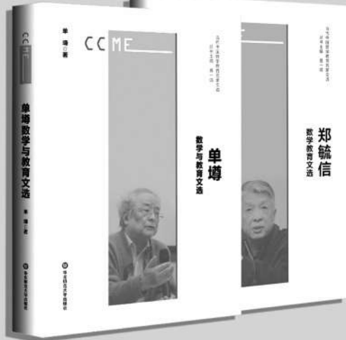
“当代中国数学教育名家文选” 曾一鸣/丛书主编