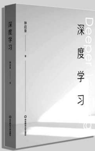
《深度学习》 钟启泉/著