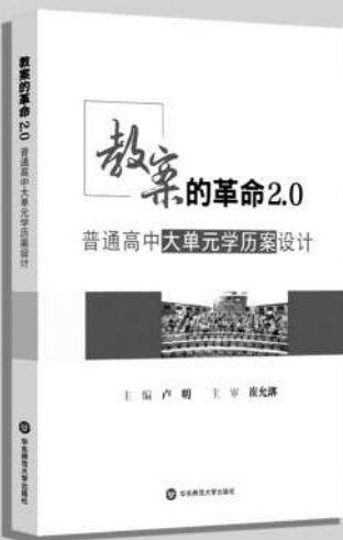
《教案的革命2.0: 普通高中大单元学历史设计》 卢明/主编 崔允灏/主审