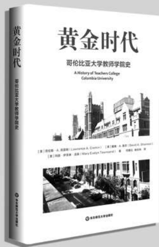
《黄金时代: 哥伦比亚大学教师学院史》 [美] 劳伦斯·A. 克雷明 戴维·A. 香农 玛丽·伊芙琳·汤森/著 何珊云 杨依林/译