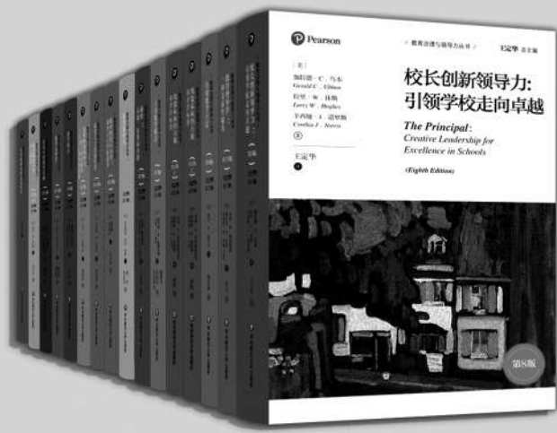
“教育治理与领导力”丛书(全14册) 王定华/总主编