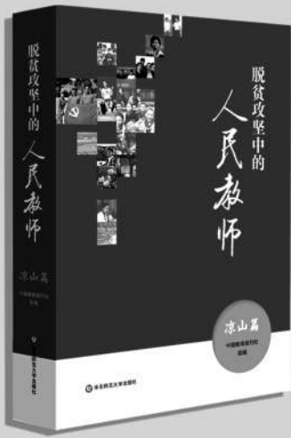
《脱贫攻坚中的人民教师——凉山篇》 中国教育报刊社/组编