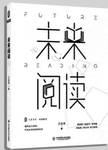
《未来阅读》 王金涛/著