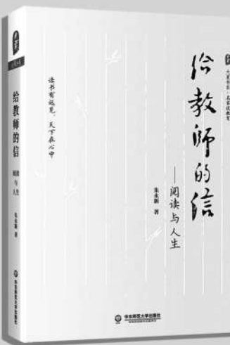
《给教师的信: 阅读与人生》 朱永新/著