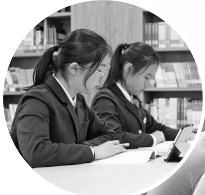
▲学生在每日自主学习时间学习。