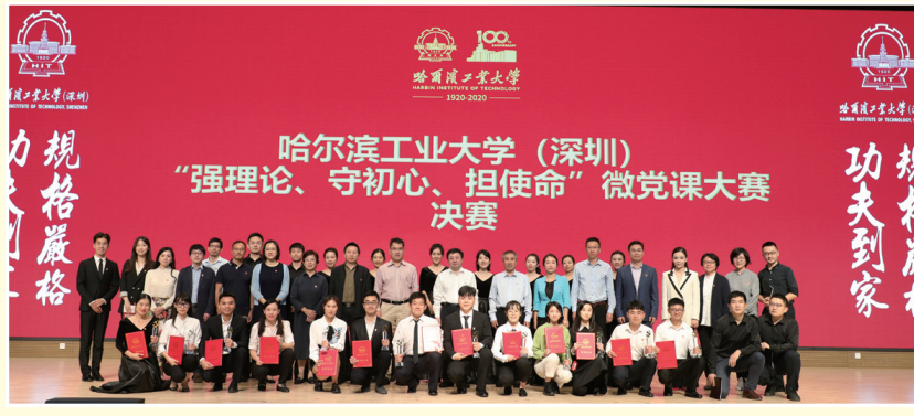
▲哈工大(深圳)“强理论、守初心、担使命”微党课大赛决赛

如何更好地将高水平党组织优势落实为学校高质量发展成效?哈工大(深圳)落实新时代好干部标准，选精配强中层干部。学校通过组织党员干部参加专题学习培训、赴企业实地调研等举措，对党员干部加强源头培养、跟踪培养、全程培养，不断提高其贯彻新发展理念、构建新发展格局的能力水平。学校既搭台子又压担子，突出在急难险重任务、基层一线、脱贫攻坚