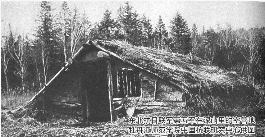
东北抗日联军第五军在深山里的密营地

坚定执着、矢志不渝的共产主义信念。东北抗联指战员自觉学习、实践马克思主义,坚持共产主义理想信念,始终把远大理想与抗战时期党的中心任务紧密结合起来,把抗击日本帝国主义、争取民族解放作为奋斗目标,在生与死的考验面前,忠贞不贰,信念坚定。杨靖宇对党忠诚,心中