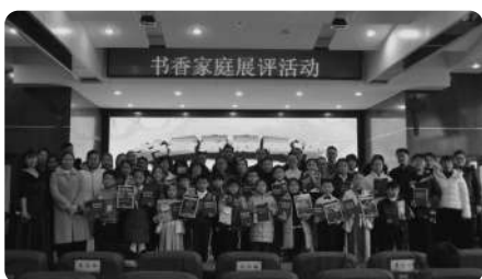
书香家庭颁奖合影