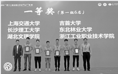
①工程测量大赛 ②湖北文理学院图书馆及主体雕塑卧龙出山 ③工程测量实习 ④暑期“三下乡” ⑤湖北文理学院在第十二届全国大学生结构设计竞赛中斩获一等奖

队，集中时间、固定地点、边教边练，按照“建筑→结构→施工”实训流程进行流水式作业。