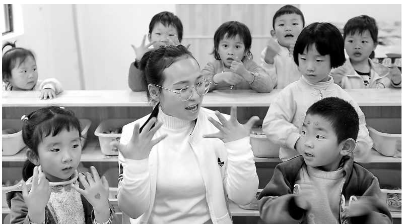
日前,贵州省遵义市播州区枫香镇香坝小学幼儿园老师教孩子们唱儿歌。该园针对留守儿童开展心理辅导和丰富多彩的活动。

2018年夏季,正在柯爱宝左右为难时,忽然传来振奋人心的消息,政府投资560余万元,占地5600多平方米,高标准建设的涂家垌镇中心幼儿园秋季开学招生。中心幼儿园可容纳200名幼儿,镇政府安排校车接送,确保周边8个村、方圆10公里的幼儿应入尽入。 党和政府真是雪中送炭呀,是咱们群众的主心骨。得知这个消息,