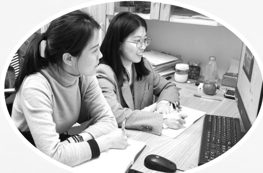
教师参加线上共读

今年1月,成尚荣老师出版了新著《做中国立德树人好教师》,很快就备受关注。 多年来,成尚荣老师一直深耕于课程教学、儿童研究、教师发展等学术领域,以宏阔的全球眼光和纵深的历史视野,从优秀传统文化当中提炼适合于当下的有益元素,从世界先进文化当中萃取适合于本土的价值因子,致力于建设中国特色的教育学。做中国立德树人好教师的理论诉求和意义框架,正是其中的核心构成,它既有宏观的朝向未来的梁架立柱,可以把人带向远方,又有细部的指向当下的扶隐索微,可以启发、引导、带动你走出自身成长、自我改变的困境。