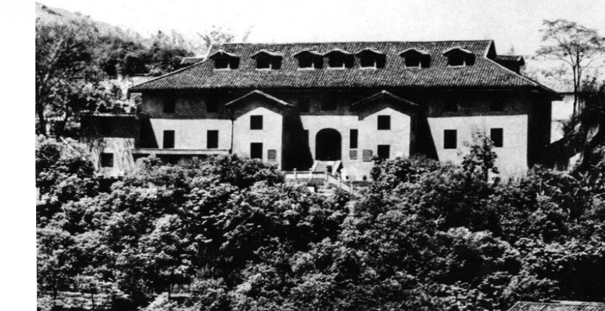
中共中央南方局暨八路军重庆办事处驻地

己青春、热血和宝贵生命捍卫革命信仰,体现了艰苦奋斗、牺牲奉献、开拓进取的崇高精神境界。红岩英烈车耀先在共产党员的影响之下,认定马克思主义才是一切被压迫阶级和被压迫民族获得解放的不二法门。他主持创办《大声》周刊,宣传抗日救国,传播革命声音,把它作为党在国民党统治区的一块宣传阵地,献出了自己的全部心血。在被捕入狱后,面对严刑拷打,车耀先坚贞不屈,严守党的秘密,并且利用在狱中管理图书的机会,增订进步报刊,传阅进步图书,把狱中图书馆变成了难友们的精神食粮供应处和通讯联络站。1945年抗战胜利,在监狱中被关押了近五年的车耀先乍闻喜讯,挥笔写下诗句,喜见东方瑞气升,不问收获问耕耘。愿以我血献后土,换得神州永太平,体现了功成不必在我的高尚思想。