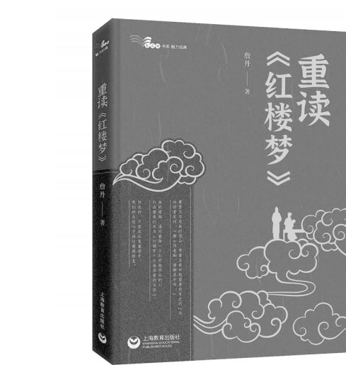
《重读《红楼梦》》 詹丹 著 上海教育出版社