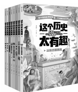
《这个历史太有趣》 齐吉祥 著 中信出版集团

每件文物的题目也让齐吉祥颇费心思。诚然每件文物都是有名字的,但那是文博人员客观反映每件文物属性的命名。为了让读者读来更亲切,齐吉祥给所讲文物都起了别称,比如他为“绣百子暗花罗方领女夹衣”起的别称