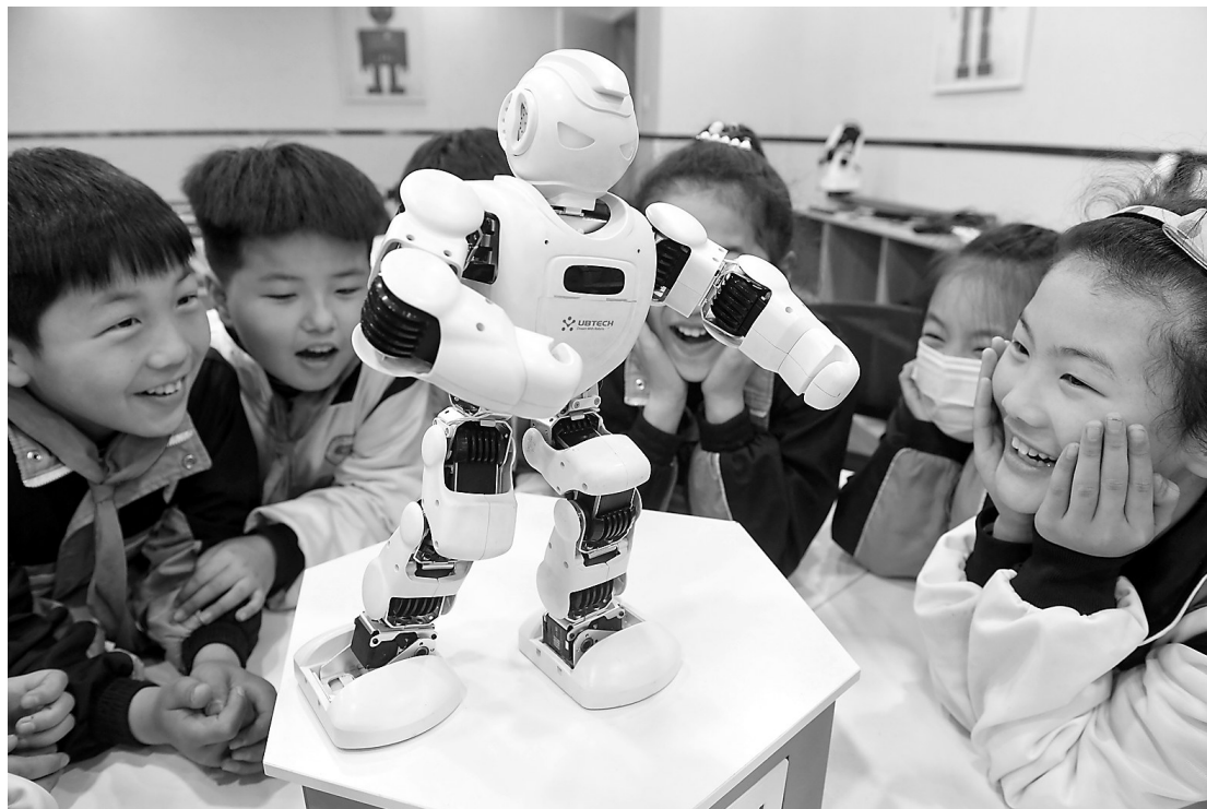
近日，安徽省阜阳市颍东区和谯谯路小学学生在科技兴趣课堂上观看机器人表演。

毛泽东在徐特立60岁生日时写信称赞道：徐老同志：你是我20年前的先生，你现在仍然是我的先生，你将来必定还是我的先生。在徐特立七十寿辰时，中共中央写信祝贺他也是中国杰出的革命教育家。(本报记者 苏令 整理)