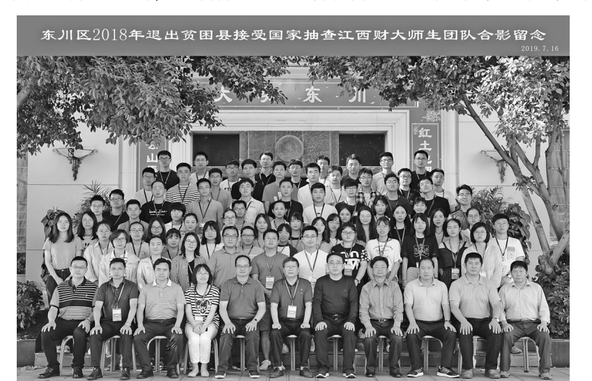
团队在云南东川调研合影

豪和队员们说：感谢共产党，感谢国家。江西财经大学统计学院院长平卫英说：江西财经大学作为全国主要的贫困县退出核查团队之一，足迹遍布了全国8个省份，我们的师生们走村串户，严格遵循退出标准，见证了人民生活翻天覆地的变化；不畏艰险，多次前往高寒高海拔地区评估；在抗击新冠肺炎疫情期间克服各种困难完成了2020年湖北、湖南的贫困县退出抽查工作。我们为能参与到脱贫攻坚这样的伟大事业中而自豪，我们深切体会到只有党的坚强领导，才能取得这样伟大的成绩。我们要继续坚定不移地在党中央领导下，努力贡献自己的智慧和力量，共同书写新的篇章。（林阳）