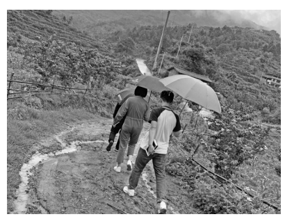
云南省楚雄市永仁县永定镇立溪冬村

扶贫效率评价研究为主线，发表了《中国贫困动态变化分解：1991-2015年》《就业扶贫、增收效应与异质性分析》《农民多维分化背景下的合作社建设与乡村振兴》等学术论文，主持了“贫困退出考核评估的统计测度研究”“后扶贫时代中国城乡相对贫困统计测度与治理机制研究”两项国家社科基金重大项目，主持完成各类相关课题40余项，在完成国家扶贫机构任务的同时，罗良清教授还主持完成各省份扶贫机构委托的贫困退出评估检查项目14项，主持其他各类国际国内横向合作项目20余项。相关成果分获全国统计科学优秀成果一至三等奖多项，江西社会科学优秀成果三等奖，并获省部级奖励及各类荣誉称号20余项。