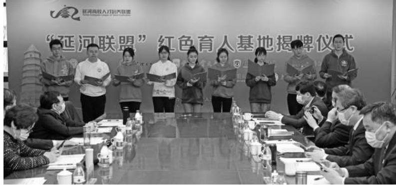
在延安大学发布“延河高校人才培养联盟”学生宣言

的岗位上书写对党的无限忠诚,让青春在祖国和人民需要的地方绽放绚丽之花。联盟高校代表还举行了党史学习教育现场教学活动,参观了延安大学校史陈列馆,瞻仰了杨家岭“七大”会址,重温了入党誓词,听取了延安大学教授所作的专题辅导报告。