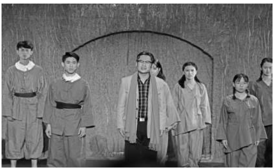
延安大学师生排演的话剧《路遥的世界》剧照

揭牌仪式结束后,举行了“延河高校人才培养联盟”种植纪念林活动,来自联盟高校的负责人栽植了象征友谊、革命与开拓精神的纪念林,并为纪念林培土、浇水,共同祝愿扎根中国大地办教育的红色人才培养之路越走越宽、越走越远;联盟高校师生代表齐唱《没有共产党就没有新中国》,表达了永远听党话、跟党走信念和决心;“延河联盟”高校学生代表共同发布了题为《到祖国和人民需要的地方建功立业》的学生宣言,倡议全国青年学生坚定爱党爱国、传承红色基因、立志扎根人民,努力成长为堪当大任的时代新人,在平凡与艰苦