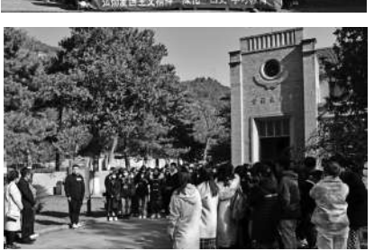
延安大学师生在杨家岭革命旧址开展“四史”学习教育

习实践精品培训路线、课程和教学项目,为全国高校及行业开展学习教育提供了有力的教学支持和资源保障。