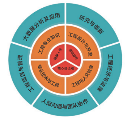
新工科 能力素质模型