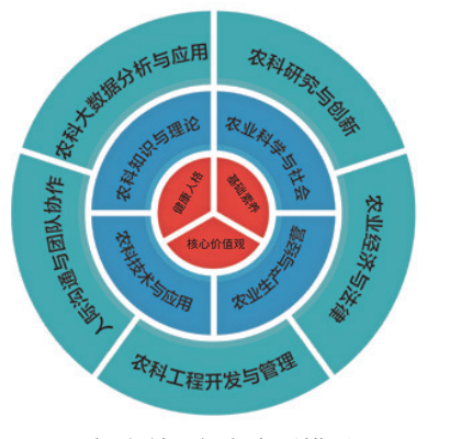
新农科 能力素质模型