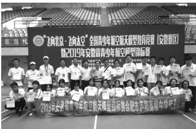
庐阳高中荣获2019年安徽省航模竞赛团体冠军