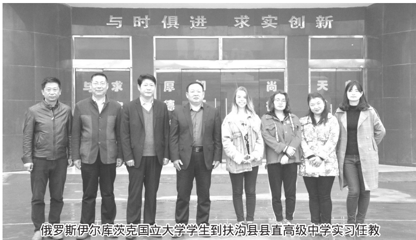
俄罗斯伊尔库茨克国立大学学生到扶沟县县直高级中学学习任教

高级中学与河南省重点高中郑州一中联合创办卫星班，把郑州一中课堂教学实况通过卫星直播到县直高中教室，开创全省卫星远程教育。学校正是以此种方式，将郑州一中原汁原味的课堂教学完美复制到县直高中课堂之上。无须远离父母，无须高昂费用，县直高中学子足不出户就能尽享优质教育资源。这种因地制宜的大胆创新，极大提升了扶沟县县直高级中学的教育教学水平，创造出独具特色的校园文化品牌。