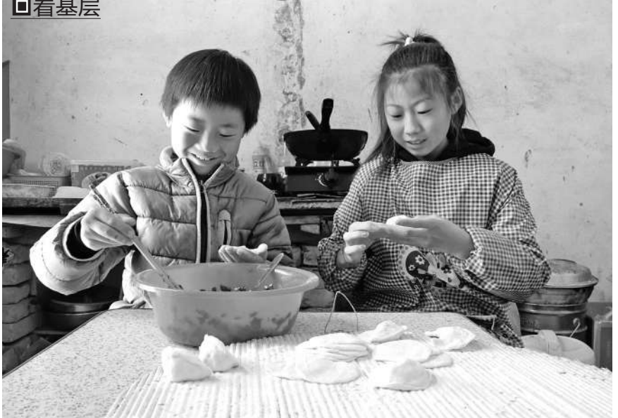
面对疫情,山东省聊城侯寨镇中心学校根据乡村孩子的实际情况,精心布置了18项别样寒假作业,既有打扫卫生、做拿手好菜这样的家务活,也有和家人做游戏、办故事会这样的增进和家人感情的内容,还有做环保布兜、做编织、做花灯等锻炼动手能力。图为这些乡村的孩子们在学习包水饺。 杨其山/文