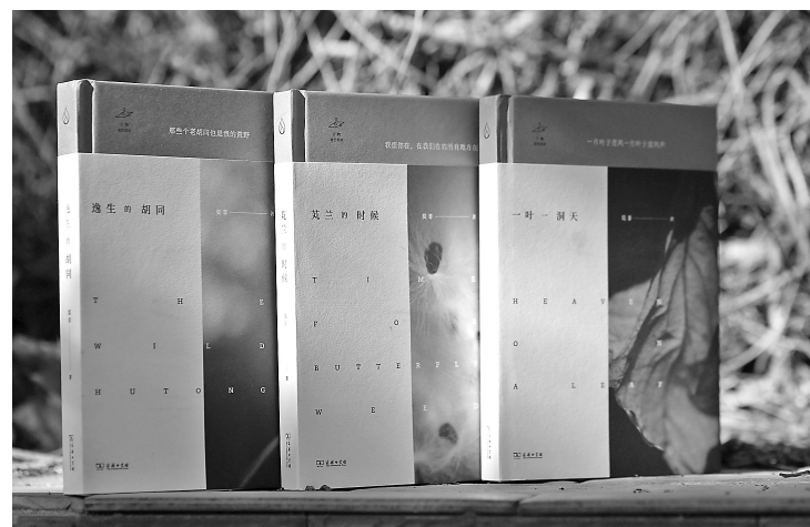
万物有生命 系列(3册)莫非 著 商务印书馆

树叶只对它自己的灌木有意义/甚至那意义也非人类所能理解/那么，一片枯叶对谁有意义呢？诗人兼摄影师莫非用两个上午的时间，在寒风中凝视天目琼花的一片枯叶，这仅有的、似乎吃进了所有的光和影，摄影师也浑然忘我，叶与人在互相等待和凝视中流出一首诗，成就了这部前所未有的书 《一叶一洞天》。