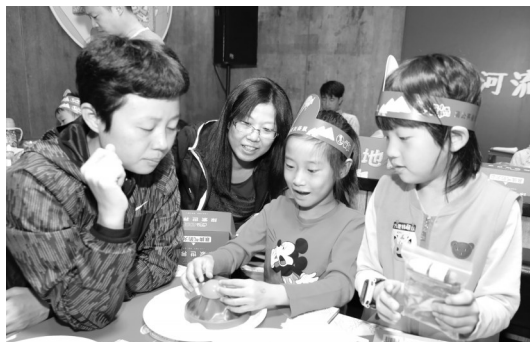
小读者和妈妈一起做火山喷发的实验。