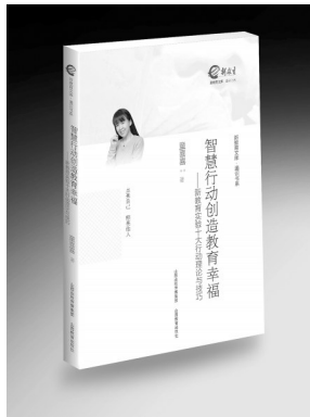
《智慧行动创造教育幸福——新教育实验十大行动理论与技巧》 董喜喜 著 山西教育出版社

喜这样的一员。她不仅是热心的参与者,还是一个引领者,更重要的是一个非常自觉的反思者。她不停地在行动中进行反思,再加以提炼。这本书实际上就是她提炼的结果。而提炼出的结果,就能起一个引领的作用。她的引领作用就是在不断地创新,就像她写这本书,能更上一层楼地提炼和总结新教育的十大行动。这也是为什么我把这本书称为新教育实验十大行动的2.0版本的原因。