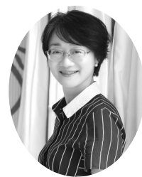
浙江省杭州市长河中学校长,浙江省政府第十届、第十一届兼职督学,国家心理二级咨询师,浙江省发展心理学会理事。

备受全国瞩目的浙江省高考改革方案的考试计分方式和高校招生录取,与沿用了几十年、大家都熟悉的高考招生方案相比,有了颠覆性的变革。