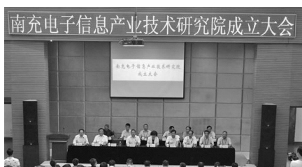
南充电子信息产业技术研究院成立大会

立德树人，薪火相传。学院长期将立德树人贯穿在教育教学全过程中。在四川省高职院校中率先成立马克思主义学院、青年马克思主义协会、习近平新时代中国特色社会主义思想研习社等，加强思想政治理论课教学、马克思主义理论学习宣传和人才培养；立足南充市域内各县市区丰厚文化资源，打造富有地域特色的 三依托三培养立德树模式；依托西充县开汉名将纪信故里的忠义文化，培养师生爱国之志；依托三国文化源头南