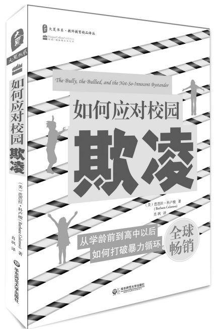
《如何应对校园欺凌》 [美]芭芭拉 科卢俊 著 肖飒 译 华东师范大学出版社

作者指出，旁观者不仅仅是一个消极的看客，通过他们的作为和不作为，可以很大程度上影响校园欺凌是否发生和发生走向：一方面，对于被欺凌者而言，旁观者的支持和保护有助于消解被欺凌者的无助感；在一定程度上起到社会支持的作用；另一方面，旁观者的袖手旁观在一定程度上可能会纵容甚至加剧欺凌行为，助长欺凌者的嚣张气焰。令人遗憾的是，由于诸多原因，旁观者更多地选择了不作为。基于大量的实证数据，作者指出，在这一暴力循环中，不少旁观者的举动无外乎以下几种：(1)抱着对欺凌的恐惧，继续把欺凌现象归咎于被欺凌者罪有应得；(2)由于看到没有任何人干预欺凌行为，他们耸耸肩，认为自己对此也无能为力；(3)事不关己，高高挂起。这些举动缩小了欺凌者的负罪感而放大了他们对欺凌对象的负面态度。作者甚至指出，旁观者的不作为，不承认欺凌