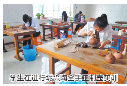
学生正在进行坭兴陶全手拉坯实训

统知识,形成基于工作过程、符合企业岗位人才标准的系列教材。2014 年至2017 年,共编写《钦州坭兴陶拉坯成型基础》《坭兴陶雕刻技法入门》《坭兴陶模型制作基础》等9 本坭兴陶专业教材,实现了坭兴陶知识的系统化整理,填补了坭兴陶民族文化遗产过程中专业教材的空白。