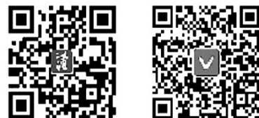
蒲公英评论网站二维码 中国教育之声微信公众号

学生的综合素质、发展核心素养,尤其是社会责任感、创新精神和实践能力的培养,都具有重大意义。 留住乡愁也罢,故土难离也罢,一个人的家国情怀不是凭空产生的,与少年时代的经历密切相关。在田间地头参与农事的经历以及乡村田野种种具体的实物和场景,把人们内心的乡愁变成了十分可亲可感的具体影像,而不会是空洞和抽象的言词。这才是根深蒂固的识五谷,更是让学生能够对待粮食、对待劳动、对待三农以及对待大自然建构一种健康、正确的观念,对于提升