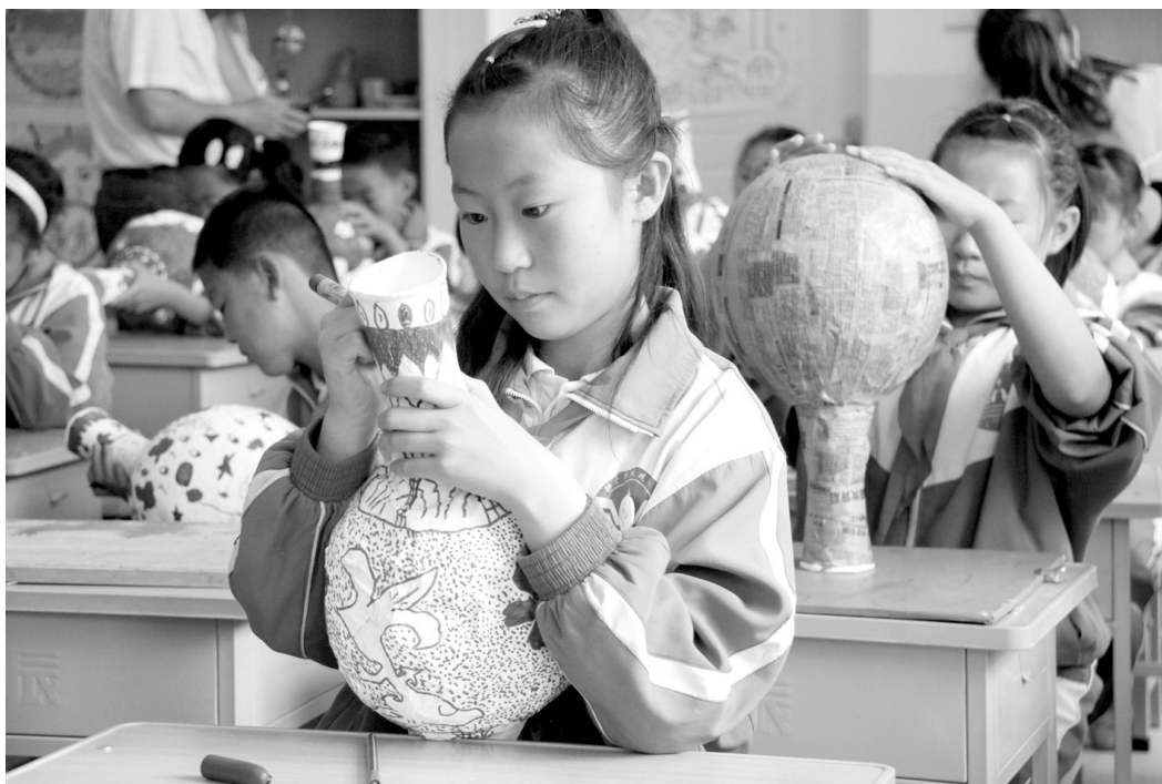
图为平凉市静宁县威戎小学学生进行手工制作。近年来,静宁县立足乡土文化,以富有特色的校本课程和社团活动为农村学校注入了新的活力。

平凉市的做法是采用联校走教模式和片区化管理。一方面专业教师通过走教把优质教育资源不断输送到小规模学校;另一方面,强校的办学理念、管理经验、教育教学模式共享,便捷地移植到弱校身上。