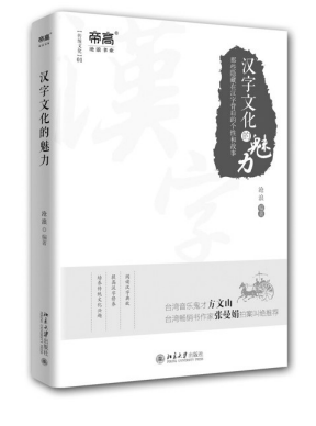
《汉字文化的魅力》 沧浪 编著 北京大学出版社

核心素养是贯穿国家课程标准修订的一根红线，是课程实施和教学改革的总纲和方向。核心素养如何落地？课堂教学怎样培育学生的核心素养？本书从理论与实践相结合的角度入手，从一线教师最为关注的内容出发，系统回应了这些问题，并从理论、观念、操作三个层面对核心素养导向的课堂教学进行了深入阐述，包括核心素养的意义、核心素养导向的教学观重建、核心素养导向的教学基本策略三大主题。