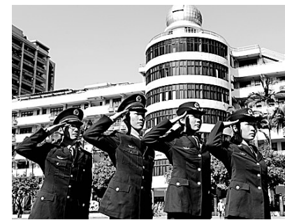
国防教育重点打造和培养现代社

广东省2017年度中小学教师教育科研能力提升计划（强师工程）重点立项。在特色课程引领下，学生增强了自我意识和自我管理的能力，促进了学生思维方式、学习方式、处事方式的改变，一大批学有特长的优秀学生在天文、无线电、机器人等省市国家科技类竞赛中脱颖而出。在体育竞赛方面，学校在田径、游泳、击剑、羽毛球、轮滑、足球、毽球等比赛中独领风骚。近三年在科技、社团、学科竞赛等方面获诸多荣誉：国家二等奖2项，三等奖1项；省级一等奖9项，二等奖32项，三等奖77项；市级特等奖1项，一等奖22项，二等奖49项，三等奖116项；区级特等奖8项，一等奖75项，二等奖117项，三等奖142项。同时，学校教育教学质量显著提高，初高中毕业班屡获广州市高中毕业班或海珠区初中毕业班一等奖。