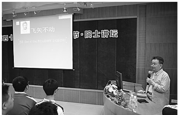
著名数学家、中科院院士张景中等专家定期来校为学生开展特色课程