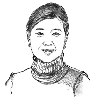
刘红宇 全国政协委员、北京金诚同达律师事务所创始合伙人

度需要人来执行,提高法治观念、诚信观念和自律意识同样重要。新高考在自主招生等环节,开始使用高中生综合评价信息,与统一高考、高中考和高校综合测试成绩一起作为录取依据。这项改革对于中学、高校乃至整个社会的诚信提出很高要求,对于自主招生将产生重要影响。客观而言,高校自主招生制度建设涉及多方面因素,需要统筹兼顾,进行综合配套改革。只有选择正确的改革路径和选拔方式,才能既提升人才培养质量,又能保障招生公平和教育公平。(作者系厦门大学教授)