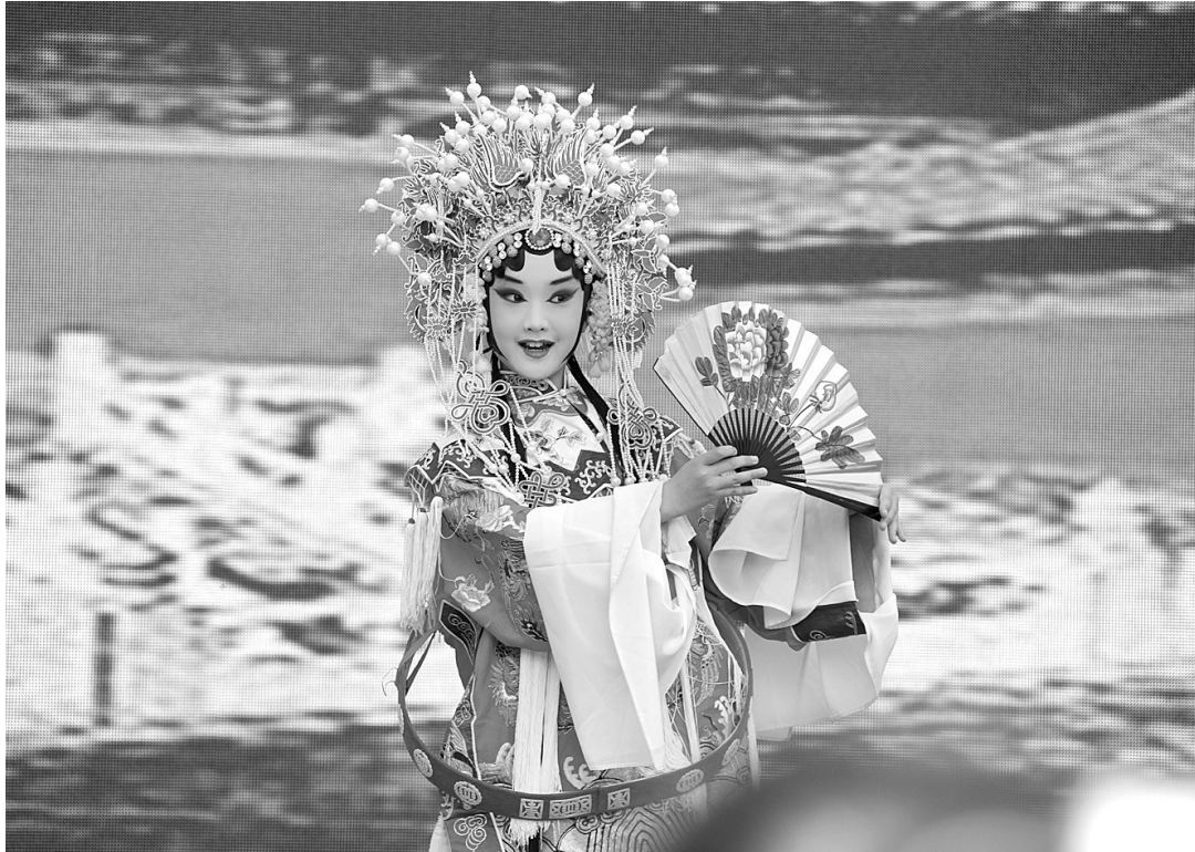
北京医科大学附属小学的学生在表演京剧。

学校办学质量的不二法门。进一步说，如果学校缺乏活力，办学没有质量，单纯地追求教育公平又有什么意义？这样的教育公平又能让师生、家长和社会最后有什么样的实际获得？