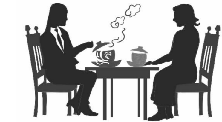
谈心 本报实习生 苏亮月 绘

自从学校实行“家长会客厅”制度以来,每月一次的“会客厅”和每学期一次的全体家长会两种形式相得益彰,收到了良好的效果。一位高年级的家长说:“原来开家长会,我们都是当听众,解决不了什么问题,现在好了,我们可以提前预约老师,可以坐下来与老师面对面地交流教育孩子的问题,而且往往能够从老师那里得到许多好的意见和建议,这种家长会的形式真好。”