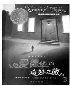
《爱德华的奇妙之旅》，[美]凯特·迪卡米洛著，王昕若译，新蕾出版社

从前，在埃及街旁的一所房子里，住着一只名叫爱德华的陶瓷小兔子。他的主人阿比林对他关怀备至，小兔子却骄傲又自大。一次意外，他从船上落入大海，开始了一段异乎寻常的旅程——从海洋深处到渔夫的渔网中，从垃圾堆的顶部到流浪汉营地的篝火边，从一个生病孩子的床前到孟斐斯的街道上……一路上的见闻令我们惊愕不已——即使是一颗极易破碎的心也可以失去爱、学会爱而又重新得到爱。