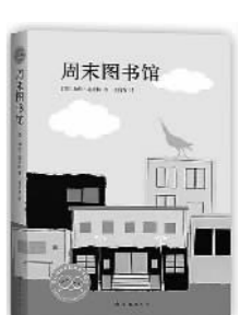
《周末图书馆》，[美]加里·施密特著，王良秀译，南海出版公司

其中《小太阳》中一个平凡家庭的一对父母、3个女儿和一只狗，在林良先生浅白、幽默又充满感性的笔触下，成了风靡台湾文坛数十年、历久弥新的《小太阳》。