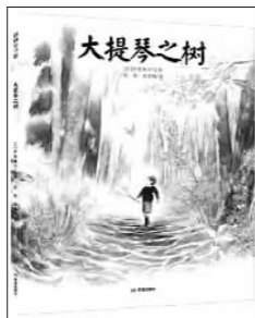
《大提琴之树》，伊势英子/文图，彭懿、周龙梅译，希望出版社

该书获得美国波士顿全球角书金奖、美国羽毛笔童书大奖提名、《纽约时报》年度杰出童书奖、《出版者周刊》年度最佳图书，入选美国教育协会评定的“教师推荐给孩子的100本最棒的书”和美国《学校图书馆杂志》评选的“100本最棒的童书”。