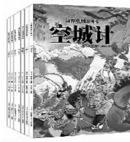
“国粹戏剧图画书”系列，海飞、缪惟编写，刘向伟、杨娃等绘画，新疆青少年出版社

孩子的成长充满了不确定性，偶然发生的一件事或许就会改变一个人的成长轨迹。有时候，这种发生和改变仅仅在内心，旁人浑然不知。男孩的内心世界更容易让人忽略，可是，生活并不会因此给他们比女孩更少的挫折和磨难。