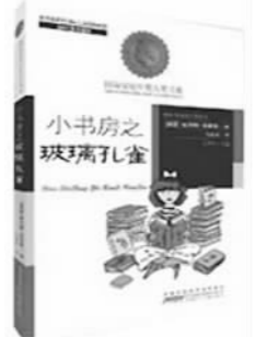
《小书房之玻璃孔雀》，[英]依列娜·法吉恩著，马爱农译，安徽少年儿童出版社

本书最大的特点是众多作者所呈现的风格和主题多元广泛，他们以很少的图像信息为基础，却能让故事走上令人惊奇的方向。根据简单的几句话和视觉上的线索，发展出一个新的故事。与其说这些故事是最终版本，还不如说它们开启了更多的对话，也打开了更多的可能性。儿童通过阅读此书可以发展想象力，学到更多的构思技巧和写作创意。