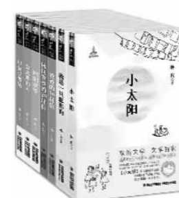
《永远的小太阳》（林良美文坊，共7册），林良著，福建少年儿童出版社

每个人都会渴望拥有超能力，并梦想通过这一能力达到理想中的完美人生。然而，当人们拥有某种能力的同时也往往被这种能力所困，问题的关键还是回到了人们对自身的认知，从而找到自己的使命（生命的意义）。少年时期的人正处于开始试图了解和认识自己，并尝试性地运用自己的能力创造事物的关键期，《校园三剑客·超时空少女》无疑会引发孩子们的共鸣，并使他们从中获得启发。