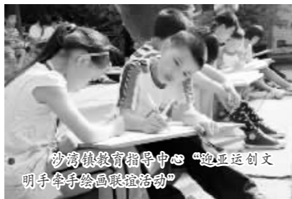
沙湾镇教育指导中心“迎亚运创文明”书画活动