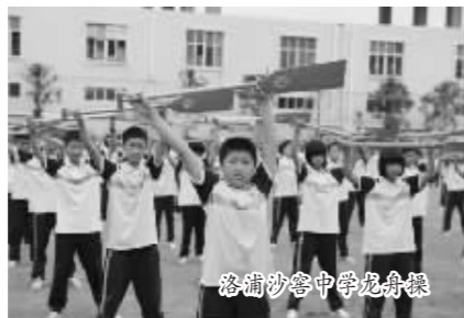
番禺沙湾中学龙舟赛

历史证明，即使方向正确了，但往往在选择道路上栽跟头。番禺区这些年来教育改革和发展，一开始就不同于其他地