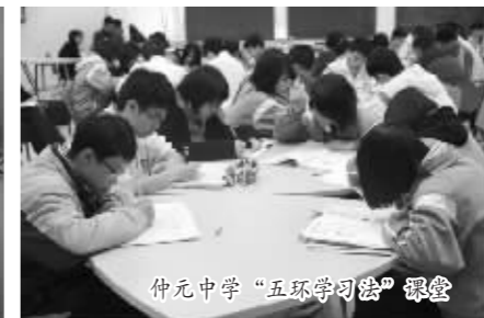
仲元中学“五环学习法”课堂