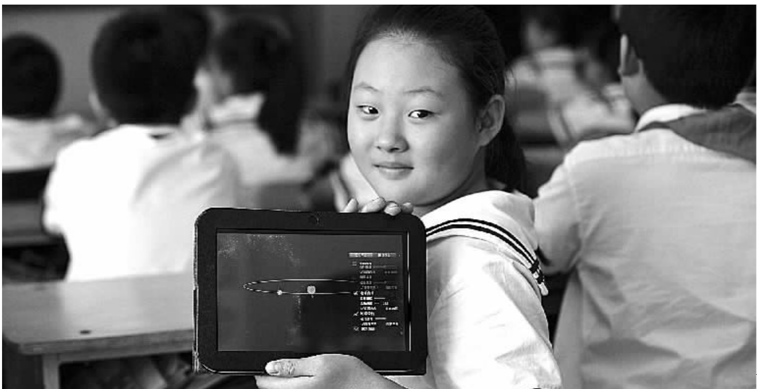
不久前在哈尔滨香滨小学举办的全国信息化教学现场观摩活动上,来自各省市区教育行政部门的有关人士到场观摩。图为哈尔滨香滨小学学生在展示使用的教学平板电脑。(资料图片)

在进入信息时代的今天,信息化已经不再只是一种技术手段,而是成为各项事业发展的目标和路径。近年来,党和国家对教育信息化的重视程度与支持力度不断加强,组织实施了一批教育信息化重点工程项目。特别是教育规划纲要颁布以来,我国教育信息化快速发展,对于促进教育公平、提高教育质量、创新教育教学模式的支撑和带动作用显著。