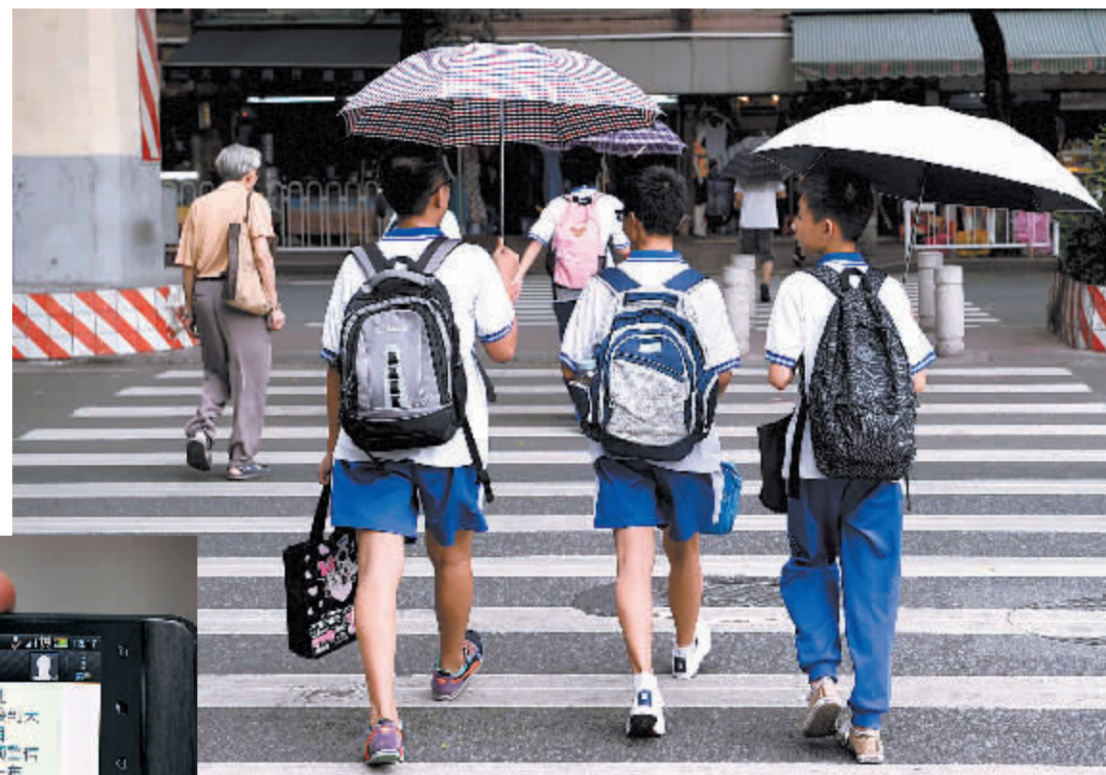
▲9月22日中午，广州市越秀外国语学校的中学生们按停课通知要求放学回家。

据中央气象台预计，未来3天，福建、广东、江西、湖南、广西、贵州等地都将受其影响出现较强风雨天气。