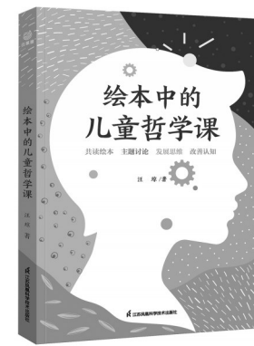
汪琼 著 江苏凤凰科学技术出版社

笔者以为，本书在以下四个方面具有参考价值：一是哲学主题。本书既没有按照传统哲学分支领域的思路来架构主题，也没有呈现出明显的学科色彩，而是从儿童的学习与日常生活出发，以教师所熟悉的语言来进行组织和重构，并为各个主题推荐了经过实践证明可运用于哲学课堂的高质量绘本。二是教学过程。本书所呈现的完整教学过程既包括了对绘本的赏析和解读，以及相关材料的准备，也提供了共读绘本时实际开展的各类活动以及师生的对话情形，特别是各个学习单元的设计，可以为教育者打开儿童哲学实践的思路，丰富哲学探究的活动产生重要的影响。三是思维练习。作者在教学中应用了相当多的思维练习工具，包括联想、想象、分享、推理、拓展、验证、链接、聚焦、