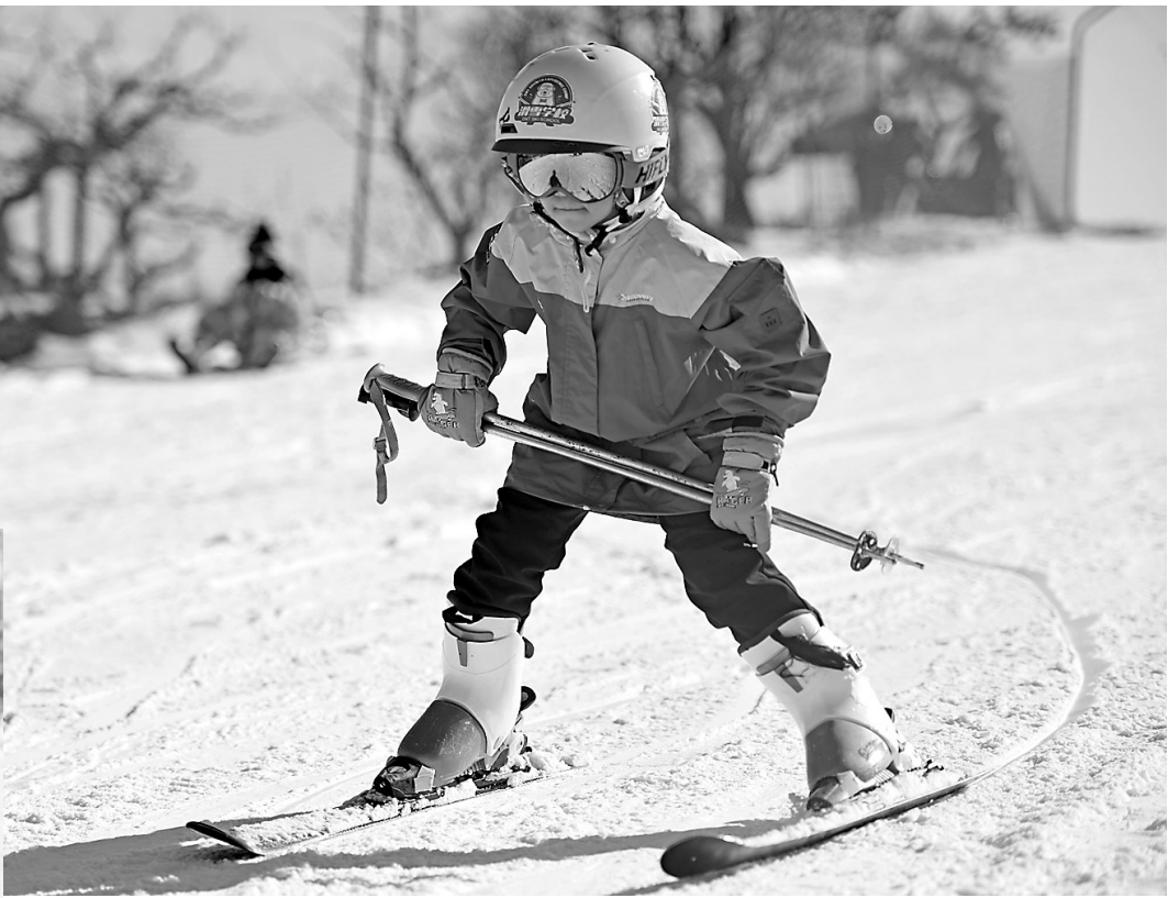
▲一位小朋友在天津蓟洲国际滑雪场内练习双板滑雪。 ▲一位小朋友在天津蓟洲国际滑雪场内整理头盔。